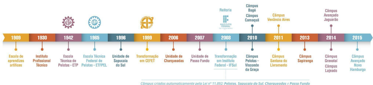
Figura 2 – Linha do tempo de evolução da Instituição

As aulas tiveram início em 1930, quando o município assumiu a Escola de Artes e Ofícios e instituiu a Escola Technico Profissional que, posteriormente, passou a denominar-se Instituto Profissional Técnico e cujos cursos compreendiam grupos de ofícios divididos em seções: Madeira, Metal, Artes Construtivas e Decorativas, Trabalho de Couro e Eletro-Chimica.