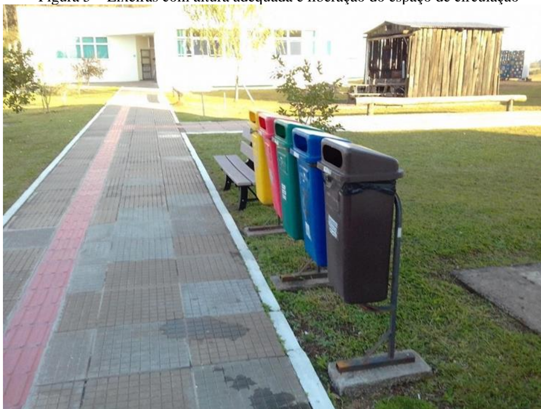
Figura 5 – Lixeiras com altura adequada e liberação do espaço de circulação