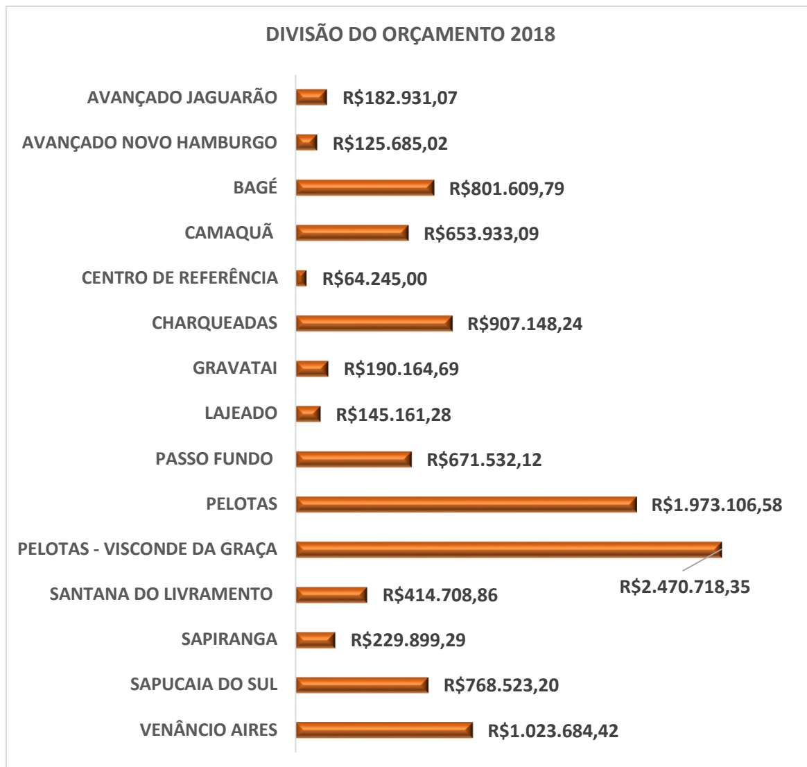
Gráfico C – Divisão do Orçamento da PAE/IFSul – 2018