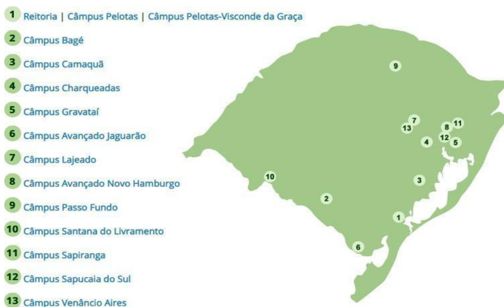
Figura 1 - Distribuição das unidades do IFSul pelo estado

Segundo a Plataforma Nilo Peçanha (PNP), que reúne dados da Rede Federal de Educação Profissional, Científica e Tecnológica (Rede Federal) para fins de cálculos de indicadores, o IFSul atende um total de 24.369 discentes (ano base 2018), matriculados em cursos nas modalidades presencial e a distância. Também exerce o papel de instituição acreditadora e certificadora de competências profissionais.