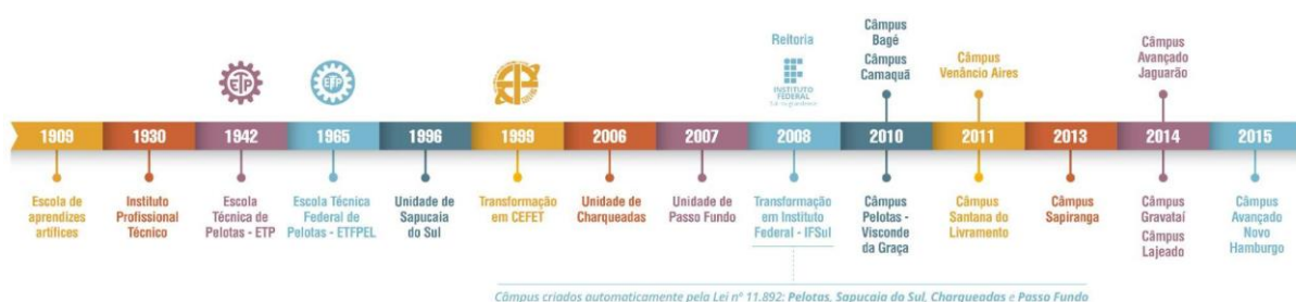
Figura 2 – Linha do tempo de evolução da Instituição

As aulas tiveram início em 1930, quando o município assumiu a Escola de Artes e Ofícios e instituiu a Escola Técnico Profissional que, posteriormente, passou a denominar-se Instituto Profissional Técnico e cujos cursos compreendiam grupos de ofícios divididos em seções: Madeira, Metal, Artes Construtivas e Decorativas, Trabalho de Couro e Eletro-Chímica.