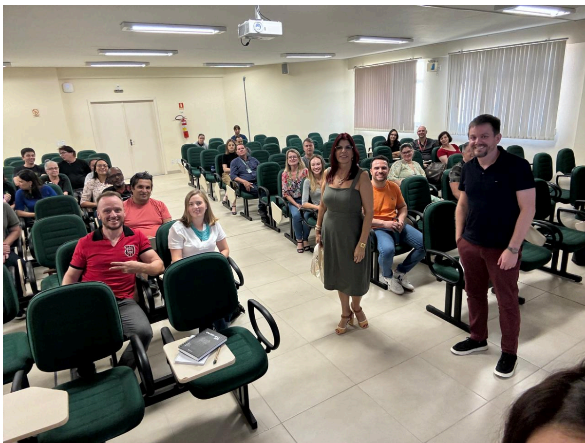
Formação do DEPEI-PROEN sobre inclusão com os servidores