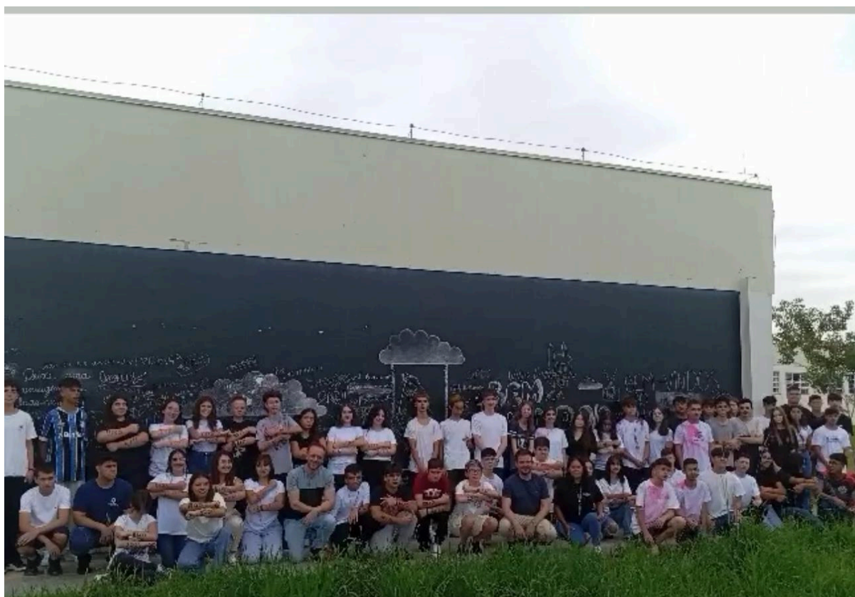
Recepção dos discentes do Ensino Médio Integrado no início do ano letivo de 2024