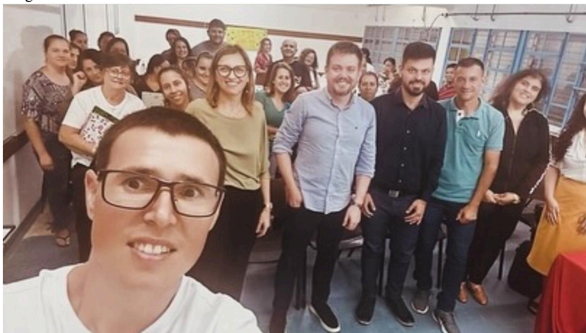
Ações de permanência e êxito na Licenciatura em História com os Polos EaD (Balneário Pinhal, Camargo, Encruzilhada do Sul, Nonoai, Santiago, Santo Antônio da Patrulha, Sapiranga, Tapejara)