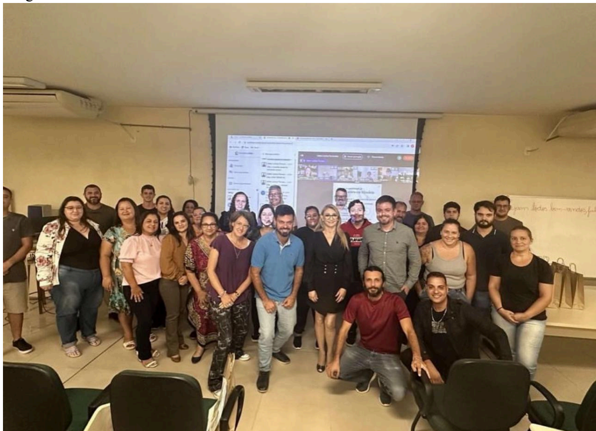
Ações de permanência e êxito na Licenciatura em História com os Polos EaD (Balneário Pinhal, Camargo, Encruzilhada do Sul, Nonoai, Santiago, Santo Antônio da Patrulha, Sapiranga, Tapejara)