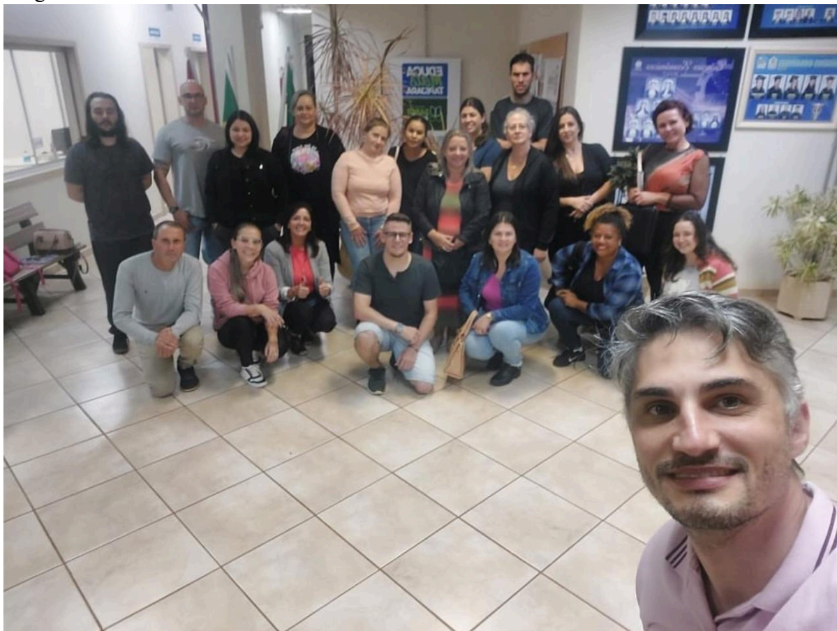
Ações de permanência e êxito na Licenciatura em História com os Polos EaD (Balneário Pinhal, Camargo, Encruzilhada do Sul, Nonoai, Santiago, Santo Antônio da Patrulha, Sapiranga, Tapejara)