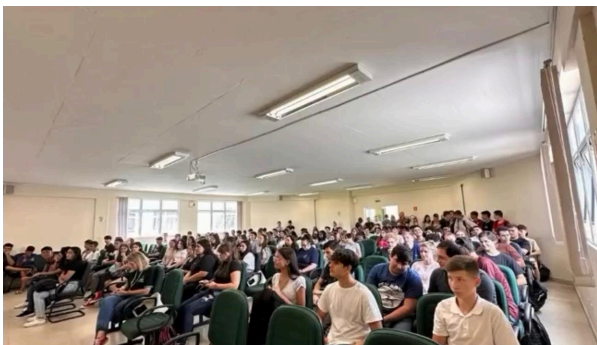
Recepção dos discentes do Ensino Médio Integrado no início do ano letivo de 2024