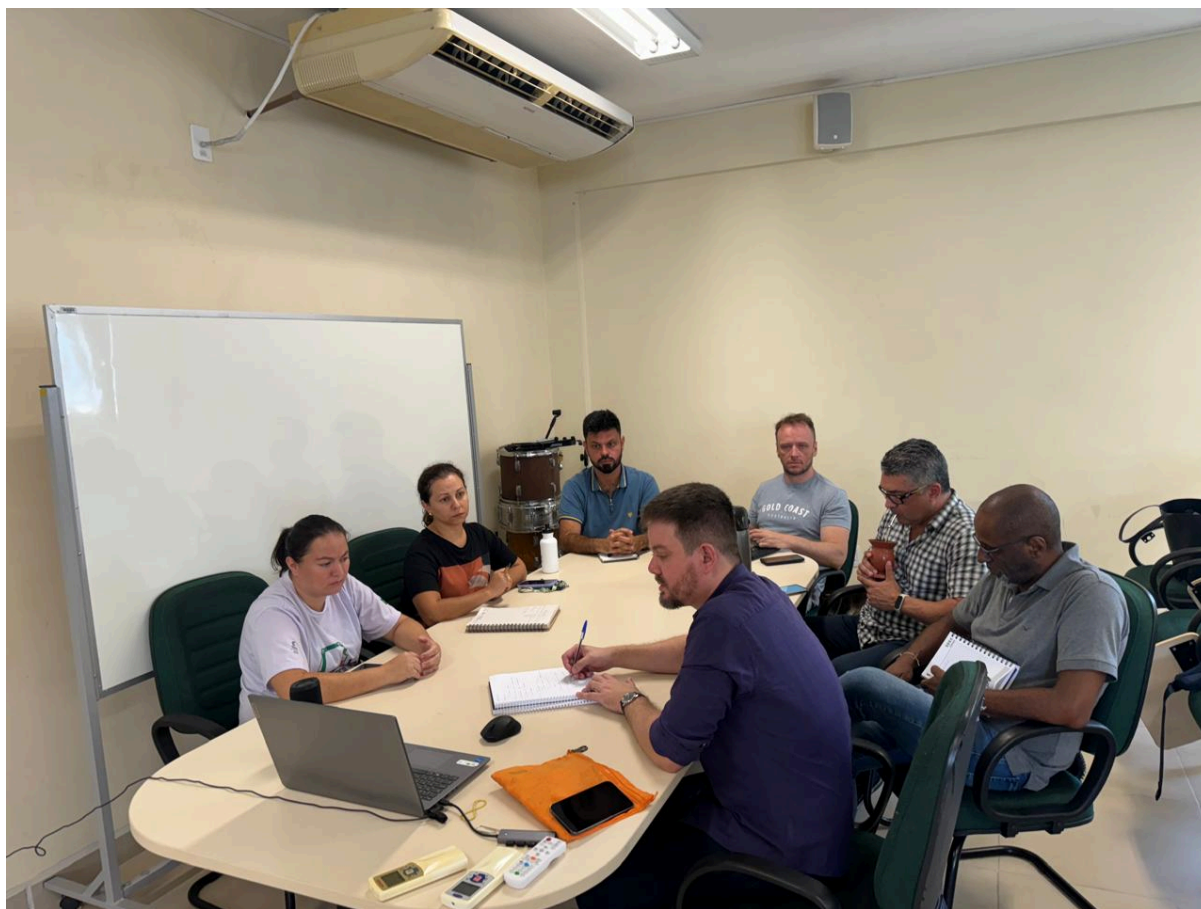
Reunião de alinhamento para discutir ações de permanência e êxito com a equipe multidisciplinar e coordenadorias