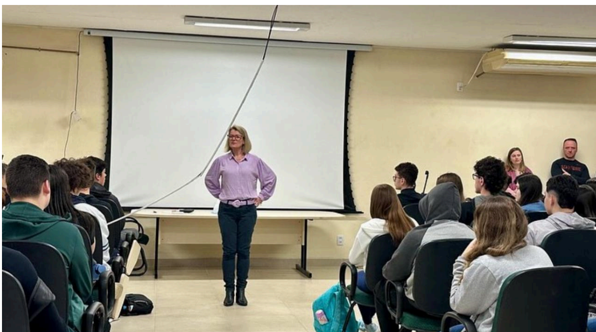
Recepção dos discentes do Ensino Médio Integrado pós greve e fatores Climáticos do ano letivo de 2024 (Direção-Geral)