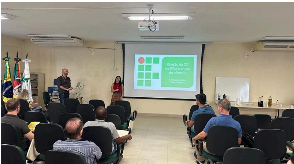
Discussão da Revisão da Organização Didática