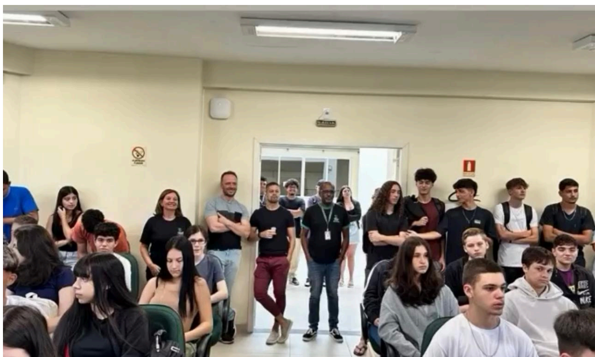
Recepção dos discentes do Ensino Médio Integrado no início do ano letivo de 2024 (Coordenações)