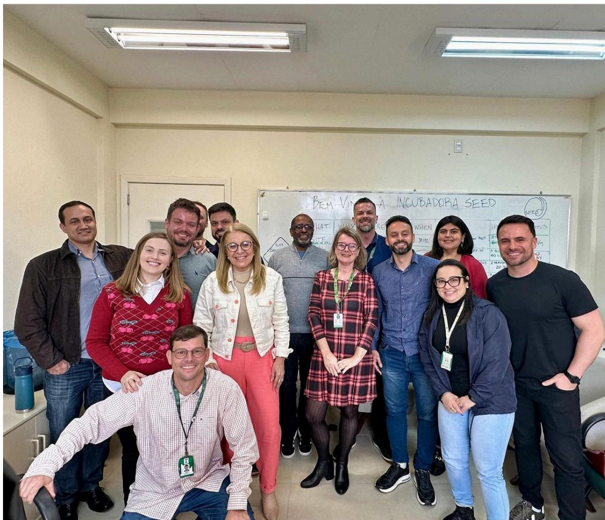
Discussão com a PROEX das Políticas de Extensão e Estágio