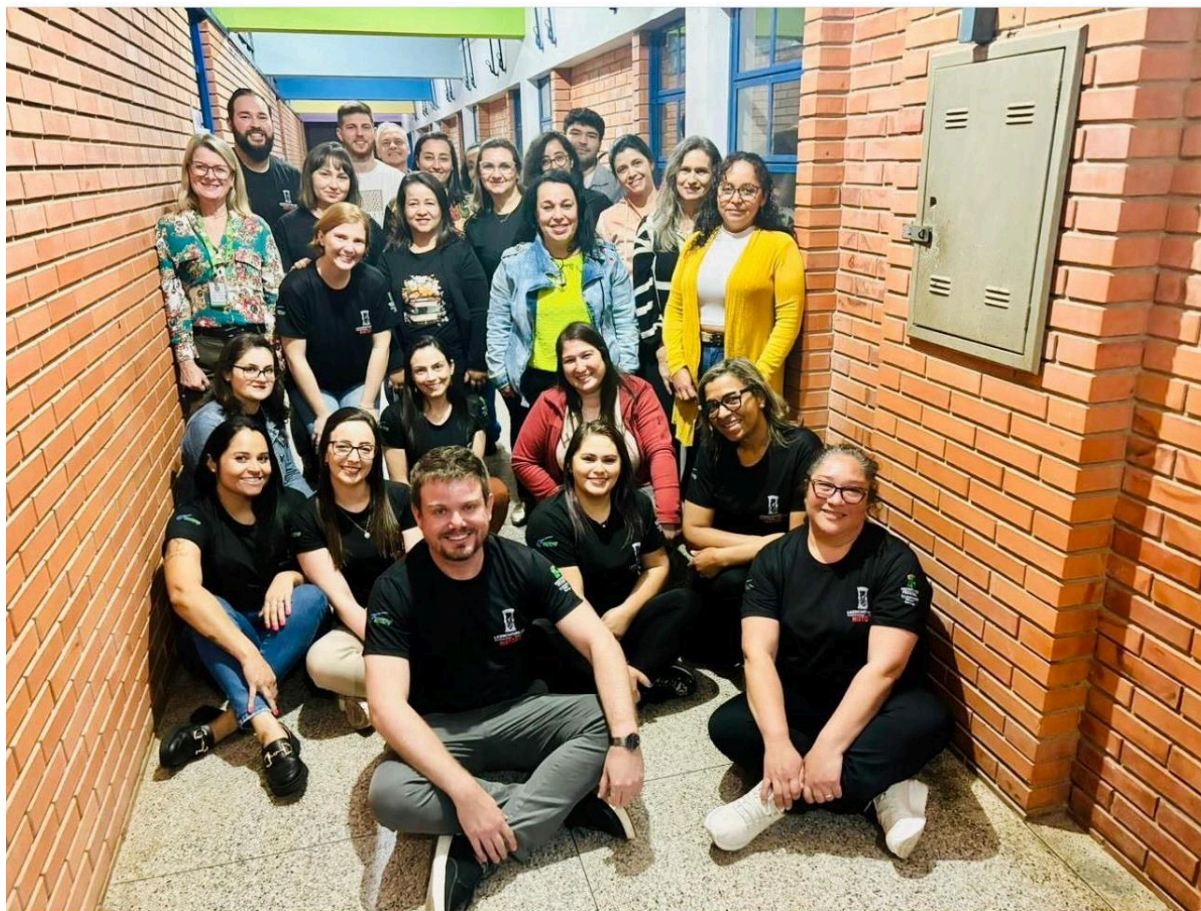
Ações de permanência e êxito na Licenciatura em História com os Polos EaD (Balneário Pinhal, Camargo, Encruzilhada do Sul, Nonoai, Santiago, Santo Antônio da Patrulha, Sapiranga, Tapejara)