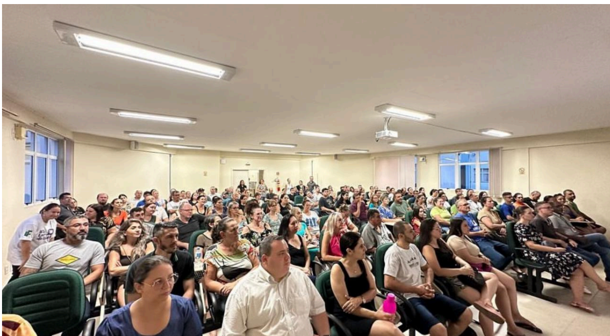
Reunião com mães e pais dos discentes do Ensino Médio Integrado no ano letivo de 2024