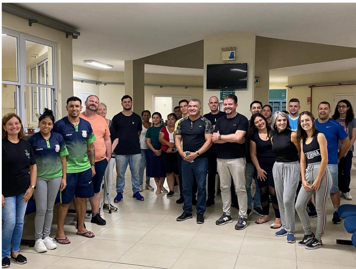
Recepção dos discentes da EJA EPT Planejamento e Controle da Produção (Noturno) no início do ano letivo de 2024 (Coordenação e Chefia DEPEX)