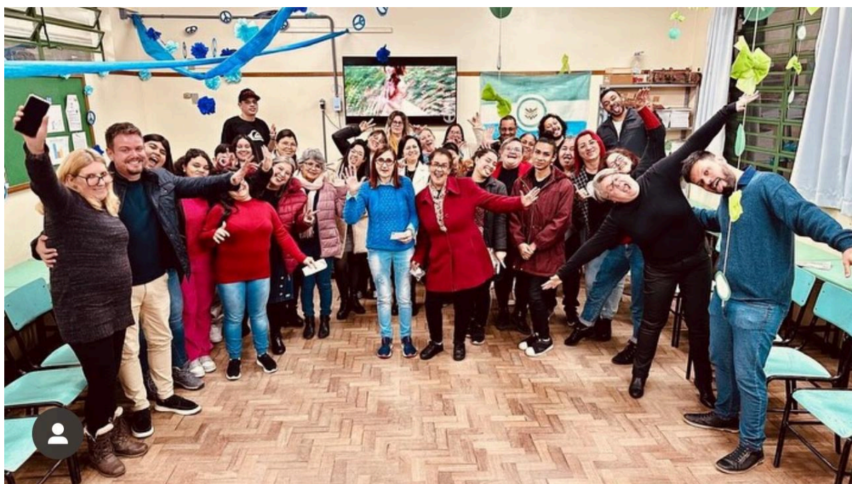
Ação de Permanência e Êxito EJA-FIC Ensino Fundamental em parceria com a Prefeitura de Sapiiranga