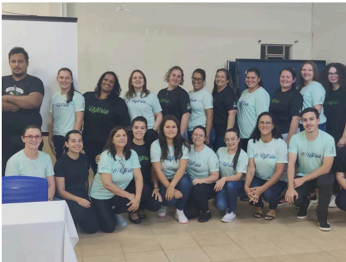
Ações de permanência e êxito na Licenciatura em História com os Polos EaD (Balneário Pinhal, Camargo, Encruzilhada do Sul, Nonoai, Santiago, Santo Antônio da Patrulha, Sapiranga, Tapejara)