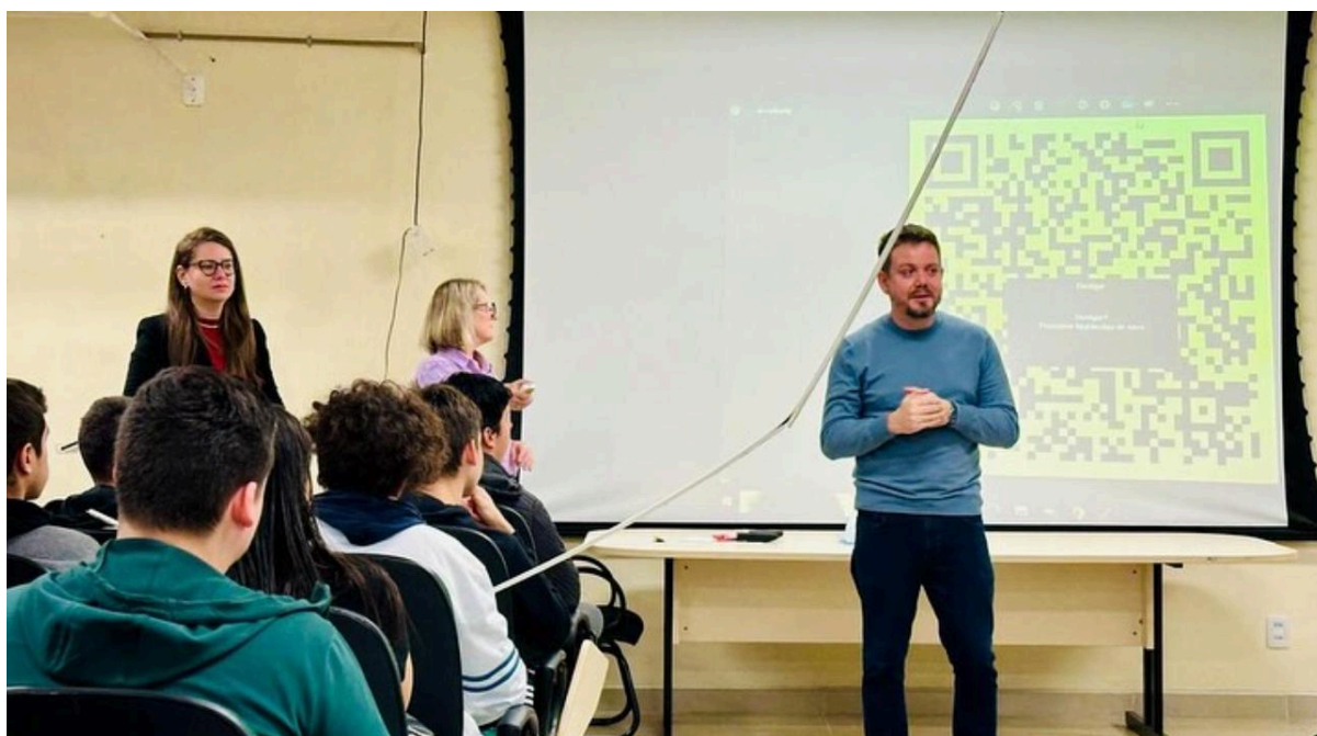
Recepção dos discentes do Ensino Médio Integrado pós greve e fatores climáticos do ano letivo de 2024