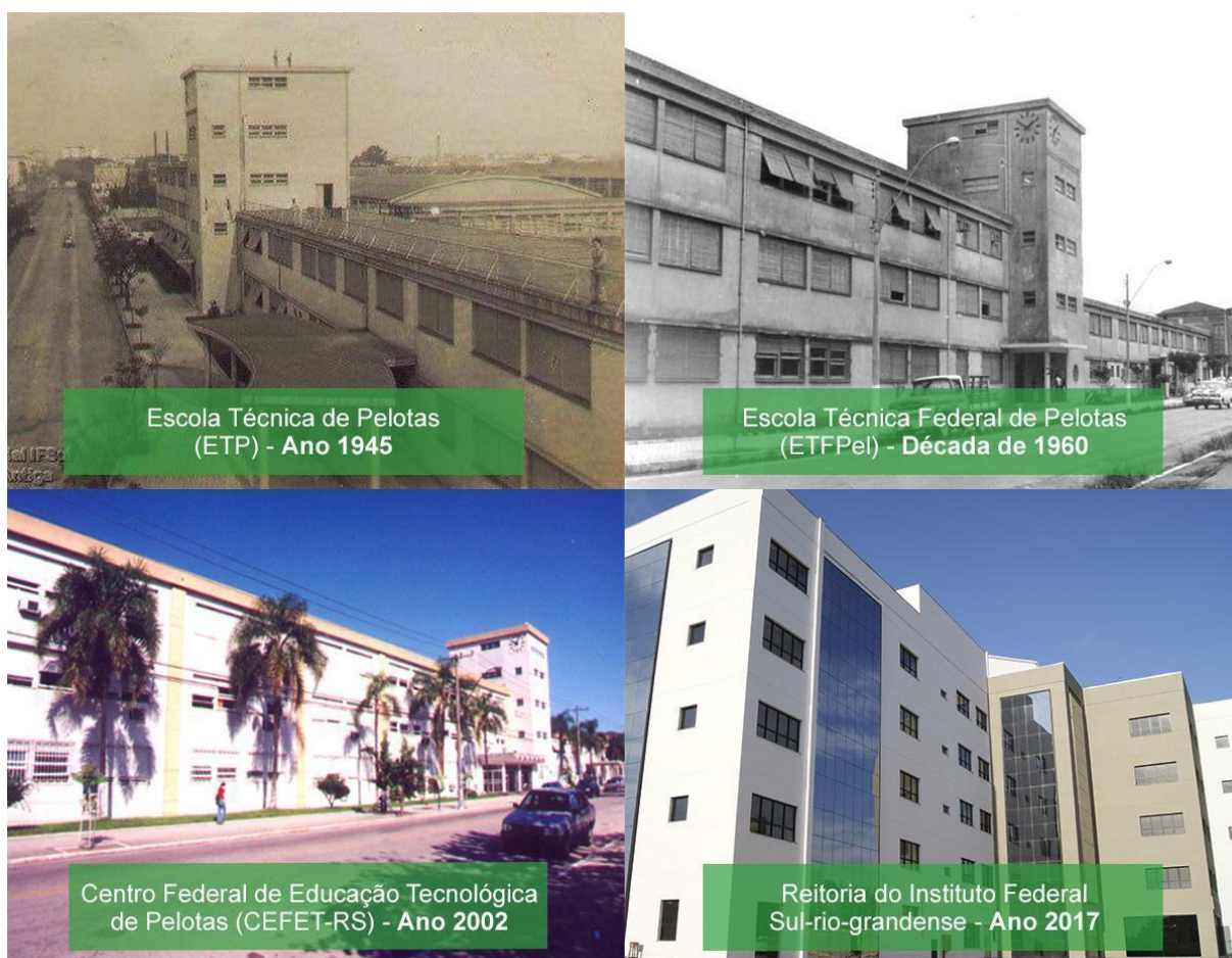
Figura 3 – Prédios da Instituição ao longo do tempo

O Instituto Profissional Técnico funcionou por uma década, sendo extinto em 25 de maio de 1940, e seu prédio demolido para a construção da Escola Técnica de