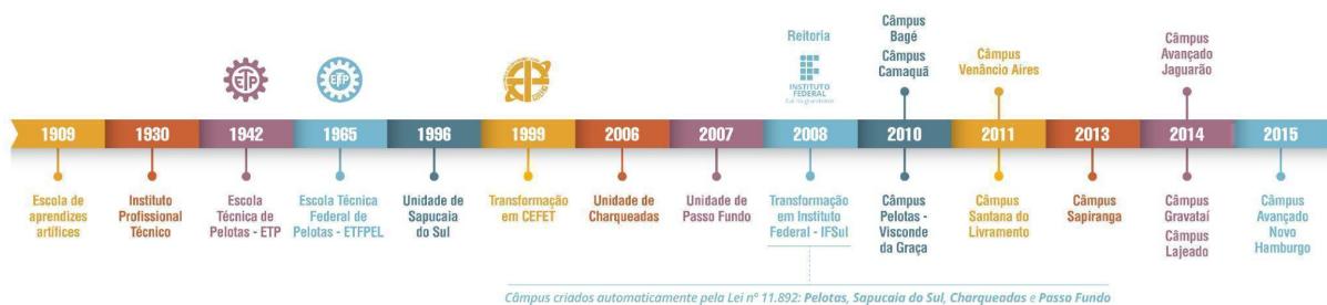
Figura 2 – Linha do tempo de evolução da Instituição

As aulas tiveram início em 1930, quando o município assumiu a Escola de Artes e Ofícios e instituiu a Escola Técnico Profissional que, posteriormente, passou a denominar-se Instituto Profissional Técnico e cujos cursos compreendiam grupos de ofícios divididos em seções: Madeira, Metal, Artes Construtivas e Decorativas, Trabalho de Couro e Eletro-Chimica.